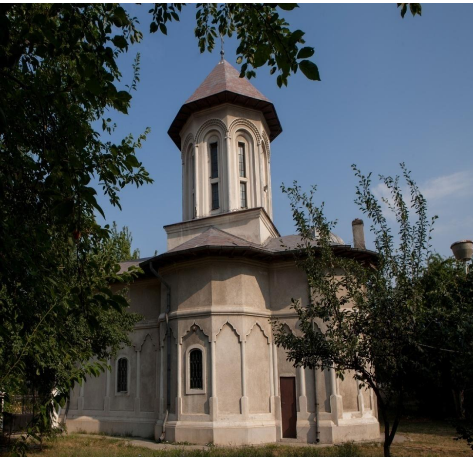
Biserica Sf. Sofia din Bucuresti